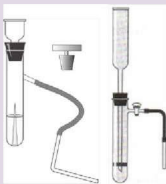
Рис. 7. Прибор для получения и собирания газов

Прибор для получения газов используется для получения небольших количеств газов: водорода, кислорода (из пероксида водорода), углекислого газа.